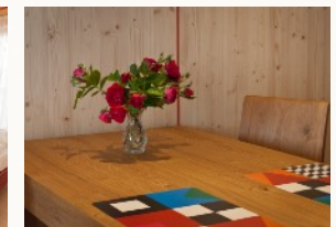
Fühlen Sie sich wohl bei uns!