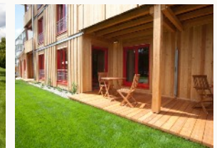
überdachte Terrasse bzw. Balkon