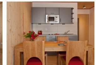
voll ausgestattete Küchenzeile